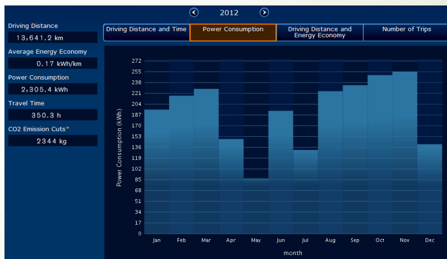
Figur 2. Faktisk månedlig strømforbruk for en elbilist med Nissan LEAF. Totalt 2305,4 kWh forbruk med kjørelengde på 13.641,2 km over et år.